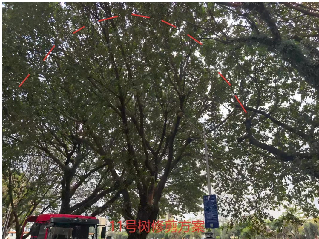
11号树修剪建示意图