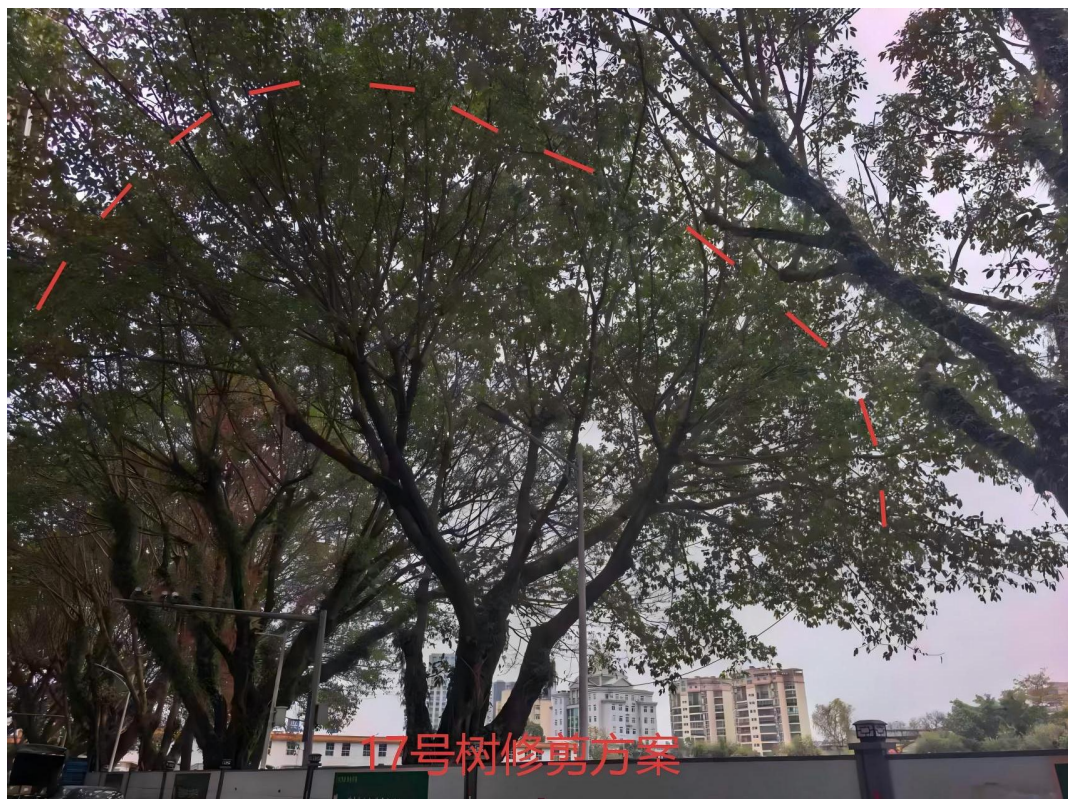
17号树修剪建示意图