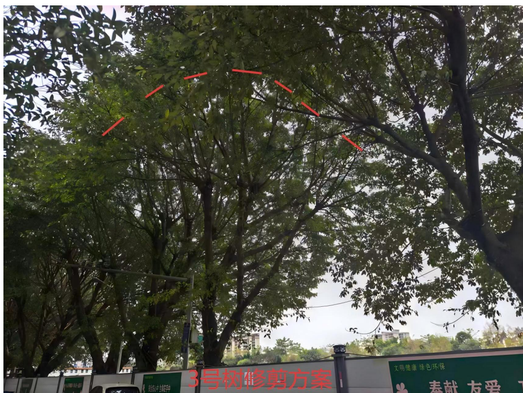
3号树修剪建示意图