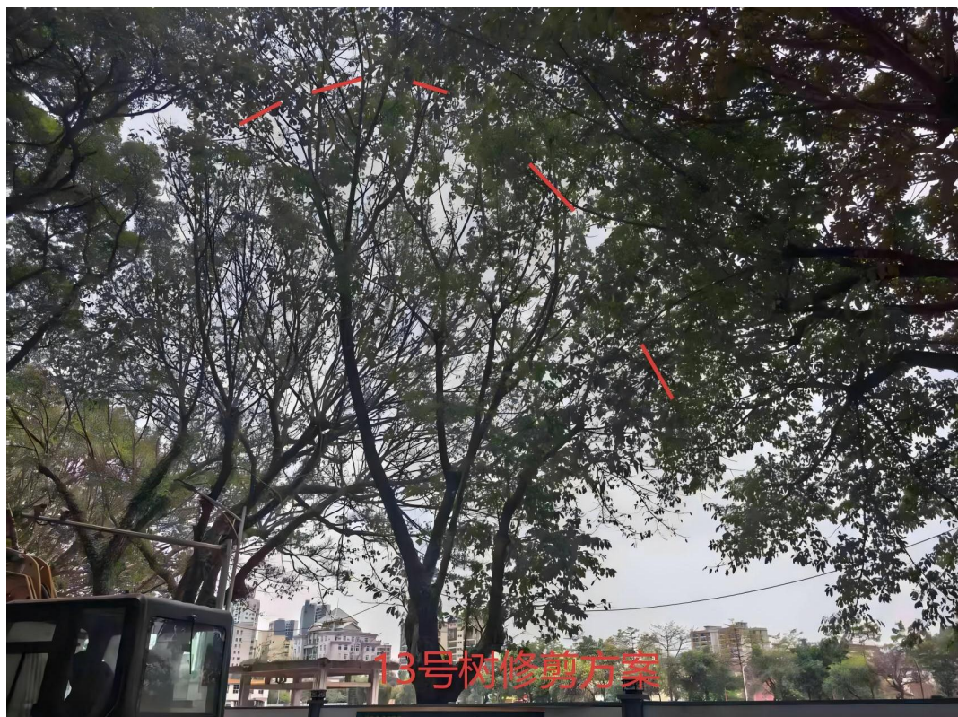
13号树修剪建示意图