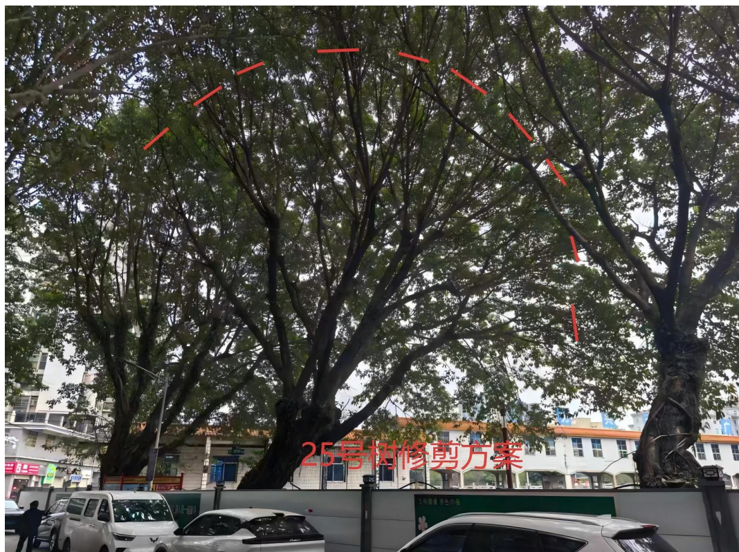
25号树修剪建示意图