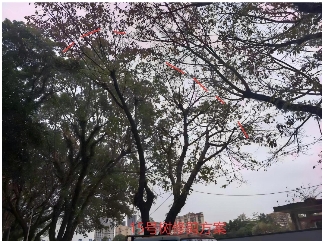
15号树修剪建示意图