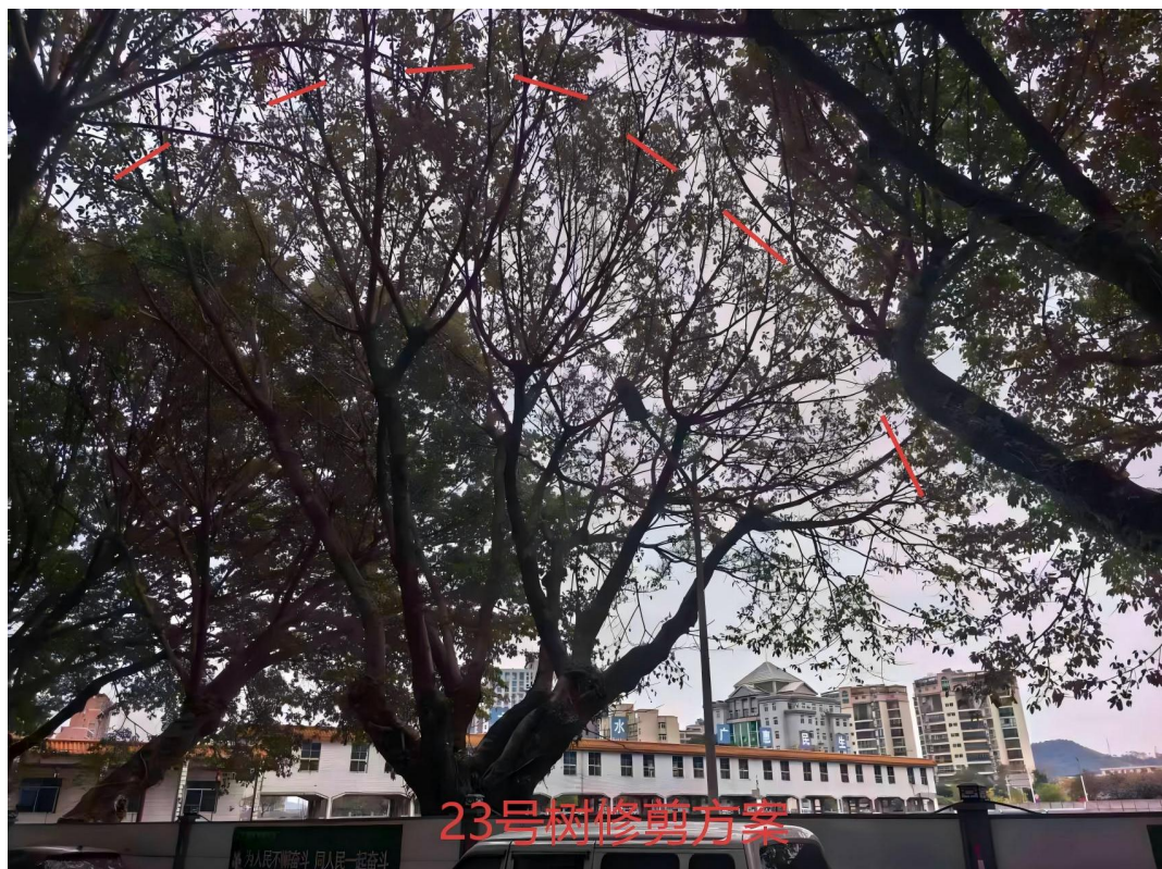
23号树修剪建示意图