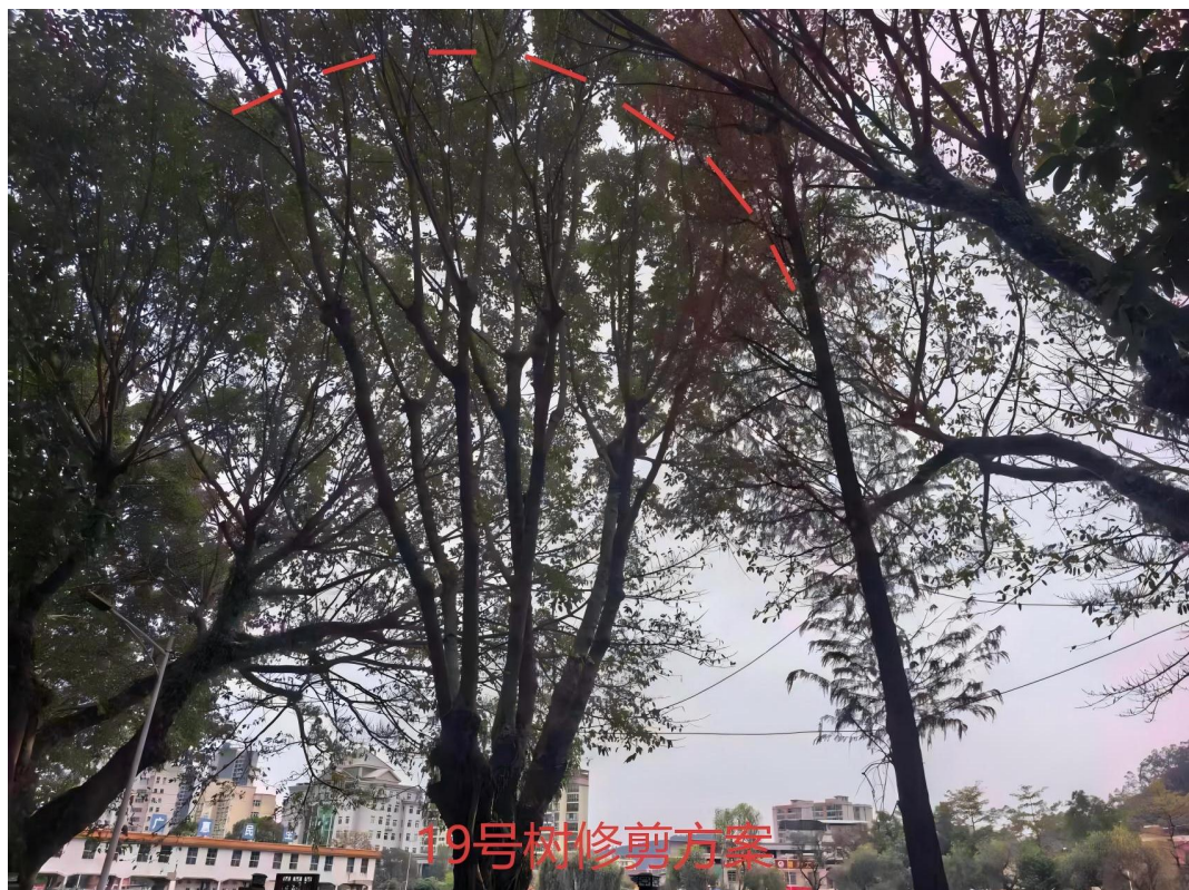
19号树修剪建示意图