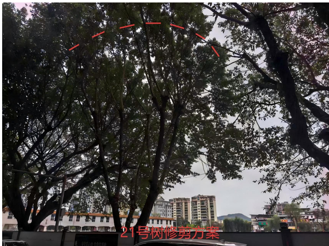
21号树修剪建示意图