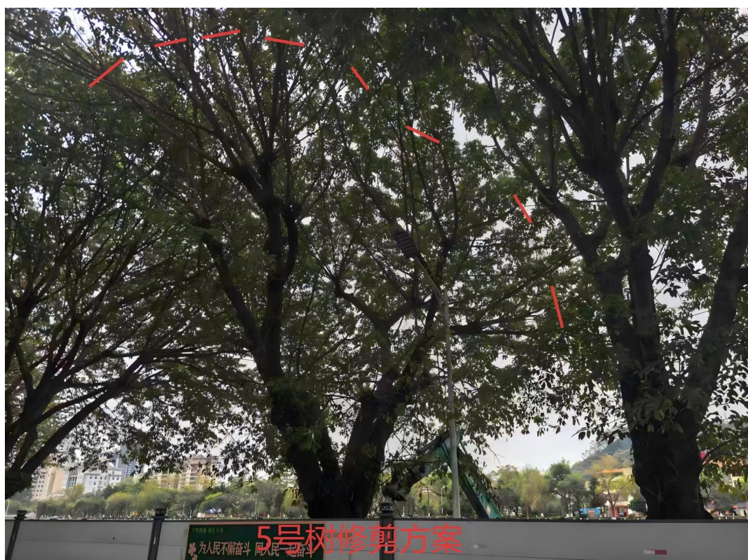
5号树修剪建示意图